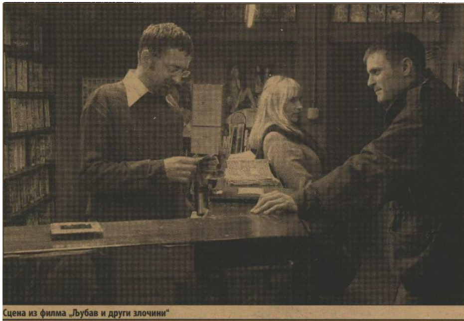
Сцена из филма „Љубав и други злочини“